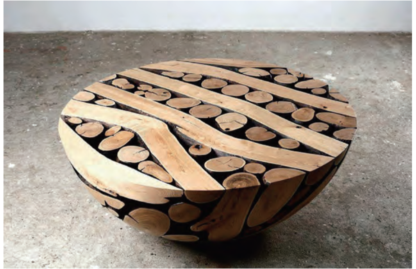
0121-1110=112089 Wood (Chestnut) 木材 [栗子木], 2012 110 x 110 x 43 cm (43 x 43 x 17 in)