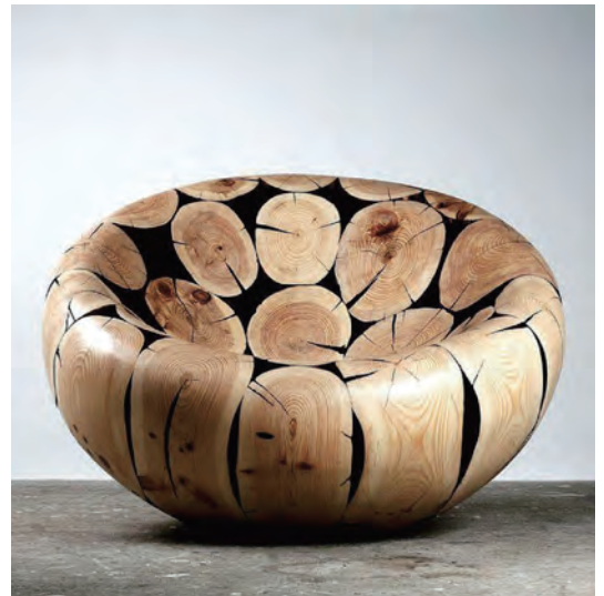
0121-1110=112094 Wood (Big Cone Pine) 木材 [大果松], 2012 122 x 134 x 88 cm (48 x 53 x 34.5 in)