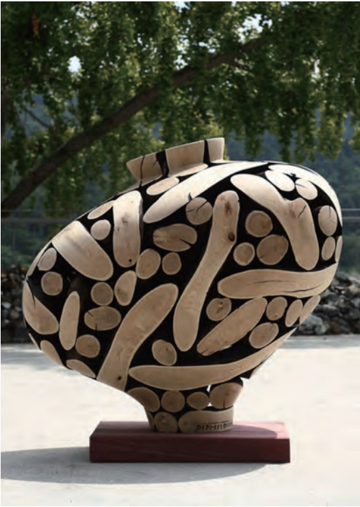
0121-1110=116083 Wood (Chestnut) 木材 [栗子木], 2016 100 x 56 x 95 cm (39 x 22 x 37.5 in)